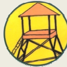
верхние ярусы прочных сооружений