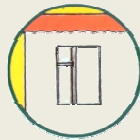
верхние этажи зданий